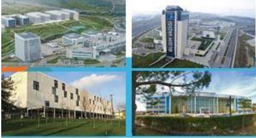
Şəkil.1. Türkiyənin məşhur texnoparklarının görüntüləri

Son 10 ildə Türkiyədə yaradılan texnoparkların iqtisadi yüksəlişinin göstəriciləri ondan ibarət olmuşdur ki, onlardan bir neçəsi Avropa İttifaqının Almaniya, Niderland, Fransa, Belçika, İtaliya və s. inkişaf etmiş ölkələrinin 100 texnoparklarının sıralarına daxil olmağı bacarmışdır. Buna səbəb kimi aşağıdakı amilləri qeyd etmək olar: