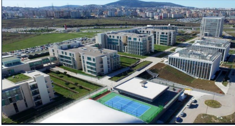
Şəkil. 2. İstanbul texnoparkının görüntüsü

mərkəzinin məzunları, inkubasiya mərkəzindən texnoparkda keçərək, fəaliyyətini orada davam etdirən 85 firmadan ibarətdir (Şəkil 2).