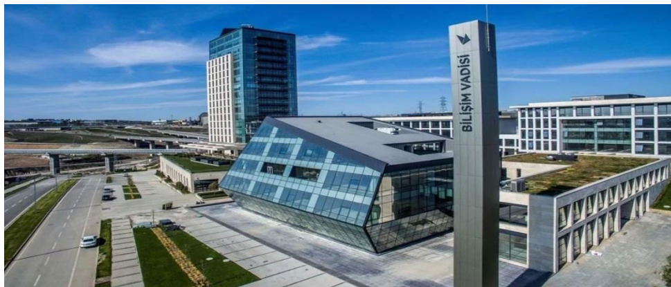
Şəkil. 3. Bilişim Vadisi texnoparkının görüntüsü.

İTU ARI Teknokent, Türkiyənin ən nüfuzlu texnologiya şəhəri 24 fevral 2022 - Teknokentdən, Texnologiya, İnnovasiya və Sahibkarlıq Mərkəzindən Business Leaders Startup jurnalının hazırladığı "Ən Nüfuzlu Liderlər" sorğusunda iştirak edib. Buna uyğun olaraq İTU ARI Teknokent olaraq ən nüfuzlu texnopolislərin reytingində birinci yeri tutub. İTÜ Çekirdek inkubasiya mərkəzimiz sahibkarlıq ekosisteminə ən çox dəyər yaradan və ekosistemi ən çox yaşadan inkubasiya mərkəzi seçilib.