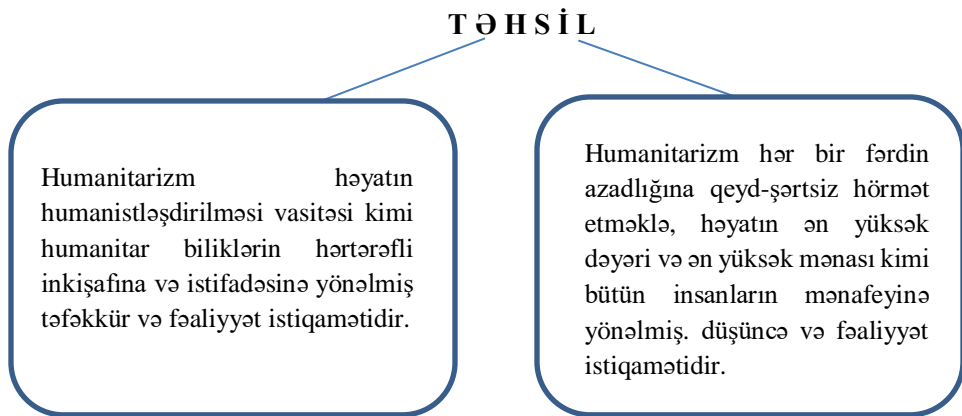
Şəkil 1. Təhsilin humanizm və humanitarizmi.

İnteqral model çərçivəsində pedaqoji təsirlər tələbələrin və müəllimlərin fərdiliyinin mümkünlüyünə yönəldilmişdir. Prosesdə insanlıq + təhsil müəllimin izah etdiyi biliklər sistemi, onun şagirdlərə göstərdiyi tərbiyəvi təsir yalnız şəxsiyyətlərin, təlim-tərbiyə prosesi iştirakçılarının fərdi xüsusiyyətlərinin sınıması ilə dərk edilir. Bu şəraitdə təhsil prosesi şagird və müəllimlərin birgə mənəvi və əməli fəaliyyətinə çevrilir. Bütün bilikdə bəşəriyyətin humanistləşməsinin ümumi tendensiyası ilə müəyyən edilir.