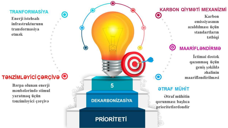
Şəkil 3. Özbəkistanda enerji sektorunun karbonsuzlaşdırılması prioritetləri (A carbon-neutral electricity sector in Uzbekistan (summary for policymakers))

Şəkil 3 Özbəkistanda enerji sektorunun dekarbonizasiyası üçün mümkün prioritetləri özündə ehtiva edir. Bu prioritetlərin müfəssəl izahı aşağıda göstərilmişdir.