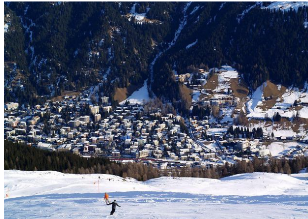
Şəkil 1: Şuşa şəhəri və Davos kurortu

Avropanın ən hündür dağ kurortu olan Davos ətrafındakı yamacları darıxmağa qoymurlar. İki yer bir-birindən olduqca uzaqdır, lakin ümumi xizək yolunu paylaşırlar. Marşrutların ümumi sayı 99, ümumi uzunluğu 320 kilometrdir. Onların bəziləri ilə zirvədən vadinin dibinə qədər dayanmadan 10 kilometr sürüşmək mümkündür.